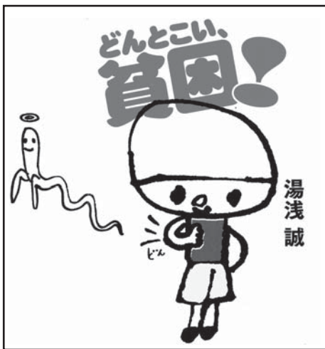
理論社 「どんとこい! 貧困」の表紙より

言葉を大切にする湯浅誠さんのお話は、とてもわかりやすく、中高生にもお勧めです。未来に希望を! 平和な「溜め」のある社会への変革のために憲法をいかに使うか、一緒に考えてみませんか。お誘い合わせの上、どうぞご参加下さい。