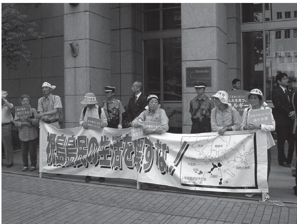
09, 6, 26中電の株主総会で抗議をする祝島の人たち

私たち、「脱原発へ！中電株主行動の会」14名は、上関原発の中止、核燃料利用禁止、自然再生エネルギーへの転換、原子力を止めるた