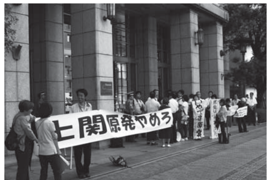
9月10日の中電前抗議行動