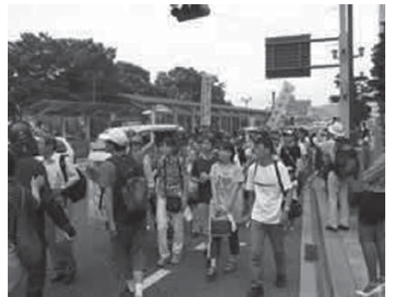
ノーニュークス・ピースウォーク