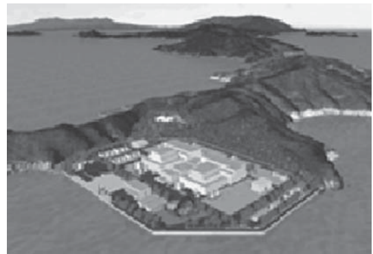
上関長島を原発建設でこんなにするな!

中国電力は、9月には埋め立て工事に着手しようとしています。工事をさせないように声をひろげていくことです。現在9月まで、上関原発建設中止の全国100万署名を行っています。是非とも協力してください。そうして、新規立地の最後になった上関原発を止めさせて、原発に頼らない社会をつくっていきましょう。(09年9月5日)